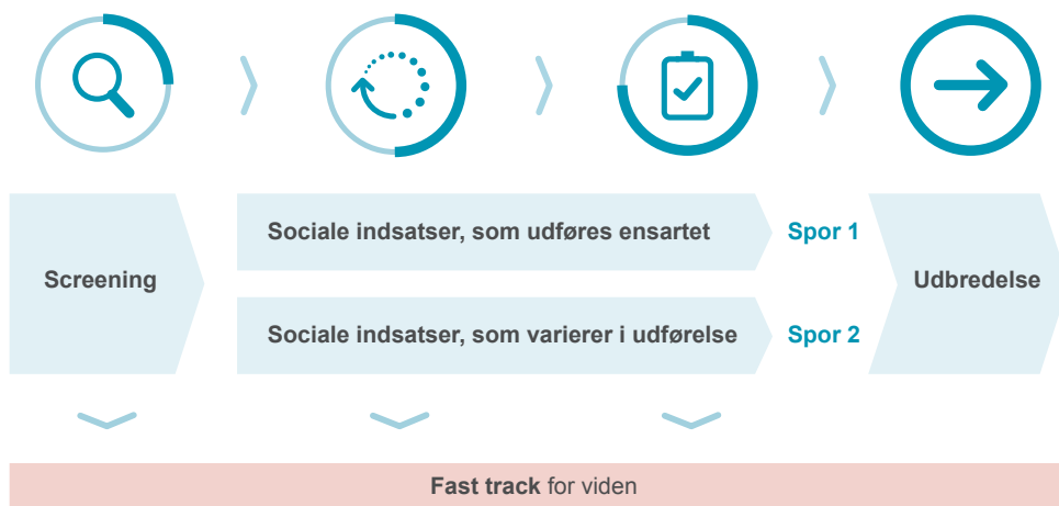
Figur 3. Fasemodellen i SUSI 2.0

Udvidelsen af fasemodellen sker på baggrund af efterspørgsel fra kommunerne og skal gøre modellen mere fleksibel, så den i højere grad kan rumme samarbejde om for eksempel en mere helhedsorienteret indsats, der tager udgangspunkt i borgerens situation på tværs af traditionelle siloer i kommunerne. Med udvidelsen kan strategien også rumme udvikling og implementering af for eksempel en ny fælles faglig tilgang, som implementeres forskelligt afhængig af lokal kontekst. Initiativerne i det nye spor 2 kan således være ret forskelligartede og kan for eksempel handle om udformning af den samlede kommunale indsats for en målgruppe, indsatser til koordinering på tværs af forvaltninger og sektorer eller udbredelse af et fagligt paradigme.